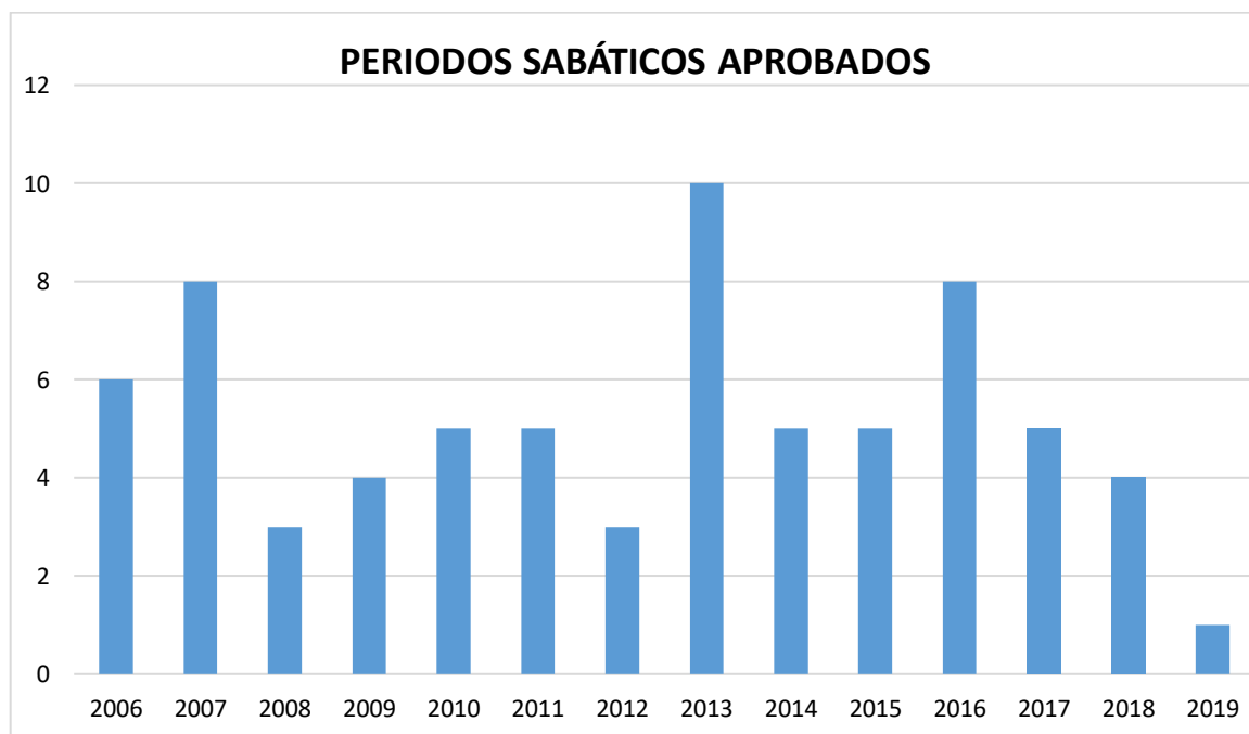
Figura 2. Periodos sabáticos otorgados desde enero de 2006 hasta diciembre de 2019.

En la figura 2, se presenta el histórico (2006-2019) de periodos sabáticos aprobados en la Universidad Autónoma de Yucatán.